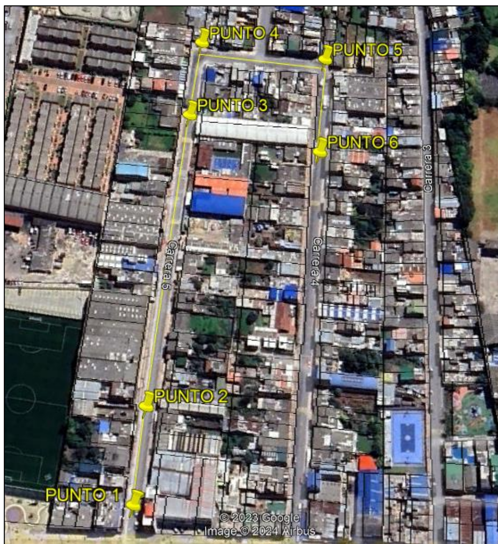
Ilustración 1. Recorrido verificación ambiental

Se realizó recorrido de control y vigilancia en el cuadrante 1, barrio LA FORTUNA el día 31 de mayo del 2024, desde las coordenadas 4°42'31,5"N- 74°12'22,638"W hasta las coordenadas 4°42'32,598"N- 74°12'12,996"W (ver ilustración 1. Ruta amarilla), con el fin de verificar las condiciones ambientales, identificar posibles afectaciones a los recursos naturales y realizar las acciones de prevención correspondientes.