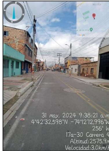
Ilustración 2. Recorrido por cuadrante